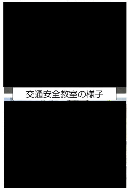
交通安全教室の様子

○放課後、たくさんの子どもたちが自転車に乗っている様子を目にします。学校では、先月末「交通安全青空教室」を実施し、自転車の正しい乗り方や交通規則の大切さなどについて、学年に合わせて学習しました。子どもたちにとってすてきな乗り物である「自転車」ですが、乗り方やルールを守らないと危険な乗り物へと変化します。是非、色々な機会にご家庭でも話題にいただけたらと思います。学校でも引き続き指導いたします。よろしく願いいたします。